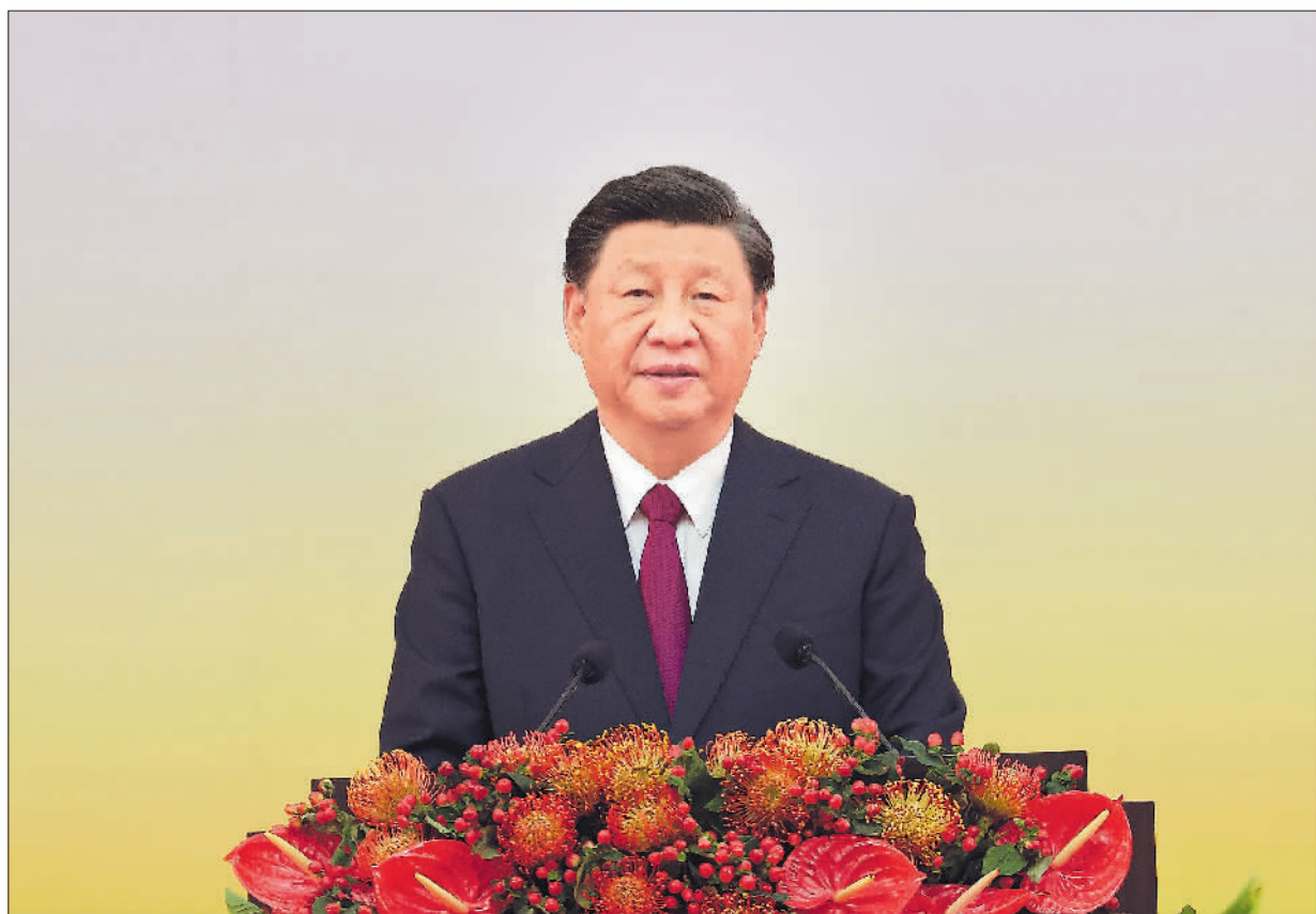
7月1日上午，庆祝香港回归祖国25周年大会暨香港特别行政区第六届政府就职典礼在香港会展中心隆重举行。中共中央总书记、国家主席、中央军委主席习近平出席并发表重要讲话。

习近平强调，25年来，在祖国全力支持下，在香港特别行政区政府和社会各界共同努力下，“一国两制”实践在香港取得举世公认的成功。“一国两制”是经过实践反复检验了的，符合国家、民族根本利益，符合香港、澳门根本利益，得到14亿多祖国人民鼎力支持，得到香港、澳门居民一致拥护，也得到国际社会普遍赞同。这样的好制度，没有任何理由改变，必须长期坚持